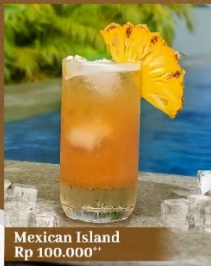
Mexican Island Rp 100.000 ++

Ceker ayam bumbu pedas goreng tepung yang disajikan dengan kentang goreng dan saus tzatziki.