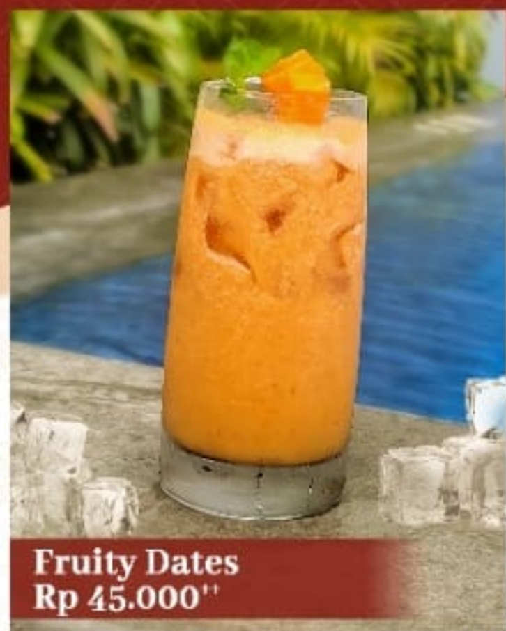
Fruity Dates Rp 45.000 ++

Ikan nila goreng yang dibumbui dengan rempah kuning dan disajikan dengan tempe goreng, daun singkong rebus, nasi putih, serta sambal dabu-dabu.