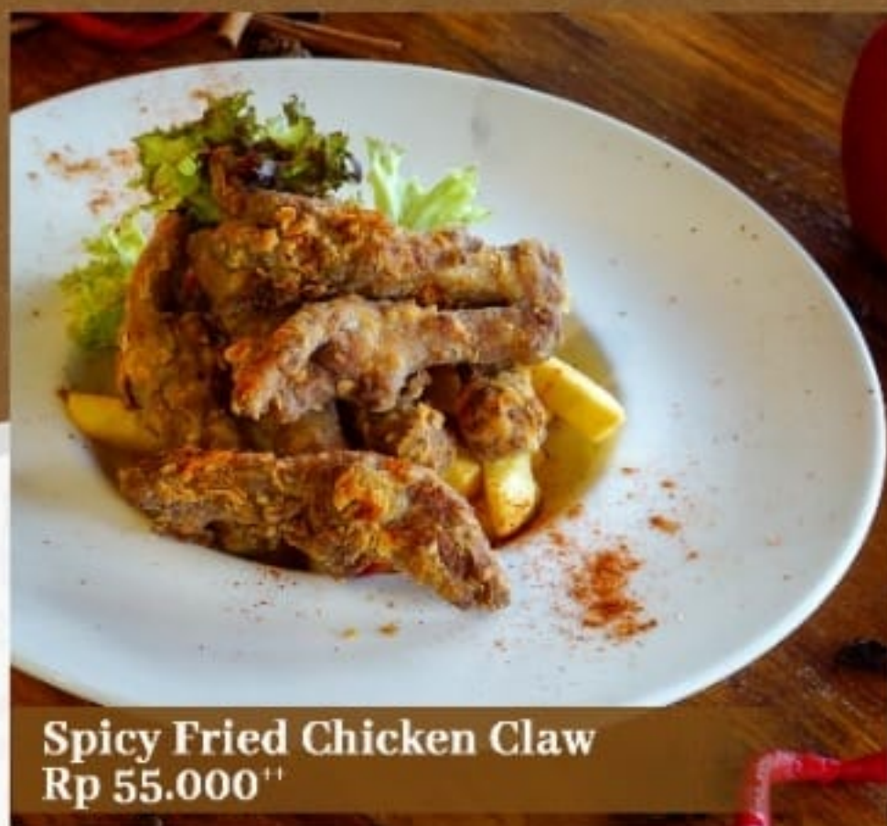
Spicy Fried Chicken Claw Rp 55.000 ++

Panganan berbentuk bola-bola kecil yang diisi dengan potongan crab stick , bawang bombay, dan keju. Disajikan dengan saus sambal dan selada hijau.