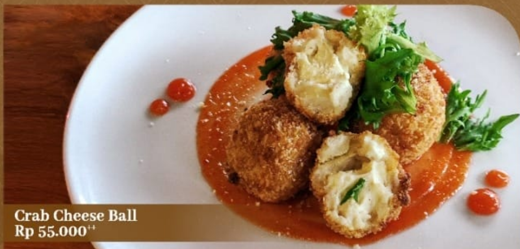
Crab Cheese Ball Rp 55.000 ++

Panganan berbentuk bola-bola kecil yang diisi dengan potongan crab stick , bawang bombay, dan keju. Disajikan dengan saus sambal dan selada hijau.