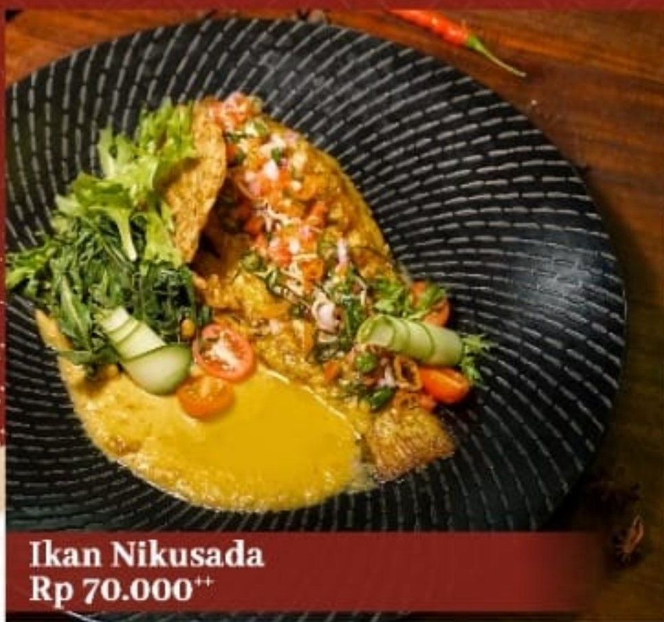
Ikan Nikusada Rp 70.000 ++

Masakan khas Tulungagung berupa ayam yang dibakar terlebih dahulu sebelum dimasak dengan bumbu rempah rasa pedas dan gurih. Disajikan dengan nasi putih dan buncis.