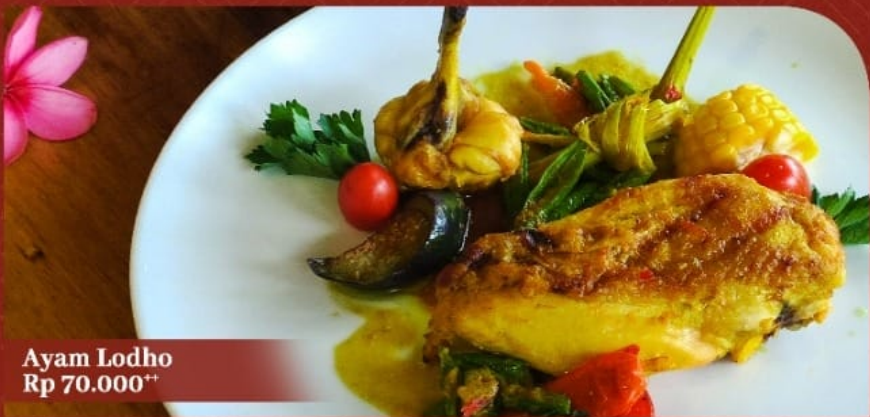
Ayam Lodho Rp 70.000 ++

Masakan khas Tulungagung berupa ayam yang dibakar terlebih dahulu sebelum dimasak dengan bumbu rempah rasa pedas dan gurih. Disajikan dengan nasi putih dan buncis.